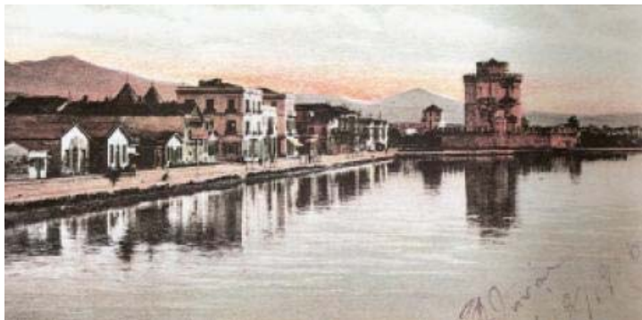
Το λιμάνι το 1906

Μέχρι το τέλος του 19ου αιώνα η πόλη γνώρισε μία σημαντική άνθιση, αναδείχθηκε σε εμπορικό και ναυτιλιακό κέντρο, μεγάλα έργα κατασκευάστηκαν και ο πληθυσμός της έφθασε τις 120.000 κατοίκους.