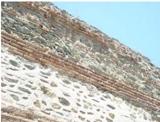
Κύρια όψη μέρους των τειχών

Σε μερικά τμήματα εκτός από τις ζώνες με τούβλα υπάρχουν και επαναλαμβανόμενα τυφλά τόξα πλινθόκτιστα, ενώ αλλού ολόκληρη η κατασκευή είναι με τούβλα. Σε ορισμένες περιπτώσεις αυτά διακοσμούνται με σταυρούς, ήλιους, πυροστρόβιλους κα. Την περίοδο της Τουρκοκρατίας οικοδομήθηκε μέρος των τειχών με απλούς πλίνθους.