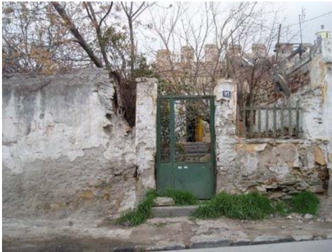
Προσφυγικό σπίτι σε επαφή με το τείχος

Όπως προαναφέραμε, μετά τη Μικρασιατική καταστροφή χιλιάδες πρόσφυγες κινούνται προς τη Θεσσαλονίκη και έτσι η ανάγκη για στέγασή τους δημιουργεί προβλήματα στην πόλη που ζητούν άμεσα λύση. Γι αυτό το λόγο δόθηκαν στους πρόσφυγες χέρσες εκτάσεις και μεγάλο μέρος των ακάλυπτων χώρων, κυρίως κατά μήκος των τειχών, εσωτερικά και εξωτερικά. Οι νέοι κάτοικοι της περιοχής εκμεταλλεύτηκαν την υπάρχουσα κατασκευή των τειχών κτίζοντας σε επαφή με αυτά. Τα σπίτια κατασκευάστηκαν με ευτελή υλικά, είναι κυρίως ισόγεια και περιλάμβαναν μικρούς αύλειους χώρους.