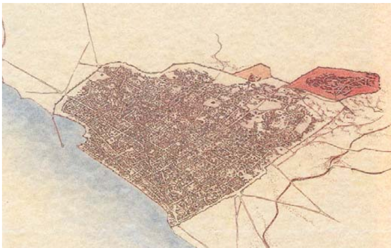
Η Θεσσαλονίκη κατά τους βυζαντινούς χρόνους