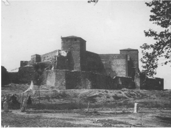
Το Επταπύργιο στις αρχές του 20 ου αιώνα

στο βόρειο άκρο από ένα ισχυρό φρούριο, το Επταπύργιο ή Γεντικουλέ, γιατί τον περίβολο υπερασπίζουν επτά πύργοι, όπως το Επταπύργιο της Κωνσταντινούπολης. Προς το μέρος της θάλασσας, περιέτρεχε την πόλη το τείχος, το οποίο βρεχόταν από την θάλασσα. Σε πολλά μέρη μπορούσαν να αγκυροβολήσουν ασφαλή τα πλοία, προς το δυτικό, μάλιστα, μέρος είχε κατασκευαστεί ασφαλέστατος εσωτερικός λιμένας.