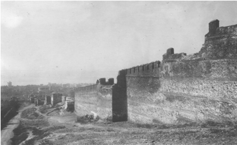
Το ανατολικό τείχος από βορειοανατολικά στις αρχές του 20 ου αιώνα

Από την εποχή του Κασσάνδρου γνωρίζουμε ανάπτυγμα τείχους, μήκους 30 μέτρων, στο ακραίο βόρειο τμήμα της ανατολικής πλευράς. Κατά την τελευταία περίοδο του μακεδονικού βασιλείου, ο αρχικός περίβολος ενισχύθηκε με ένα προσθετο λιθόκτιστο τείχος σε επαφή με το προηγούμενο από την εξωτερική πλευρά. Την ίδια εποχή, πιθανόν, επεκτάθηκε ο περίβολος προς τα νότια, για να προσεγγίσει τη θάλασσα και να συμπεριλάβει τις εκτός των τειχών δομημένες περιοχές. Τα τείχη δημιουργήθηκαν από αρχαία συντρίμια και αρχαία μάρμαρα. Ενώ οι μεταγενέστερες βυζαντινές επισκευές έχουν την χαρακτηριστική οικοδομία των βυζαντινών κτιρίων, με λίθους και πλίνθους.